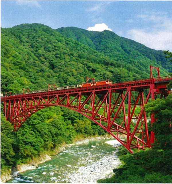
宇奈月駅を出発してすぐに最初に渡る真紅の鉄橋、新山彦橋。